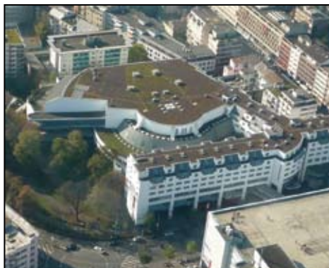
MESSE HOTEL LE PLAZA BASEL