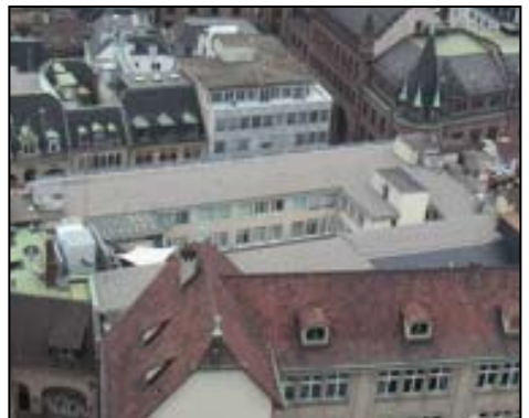
MODEHAUS SCHILD BASEL