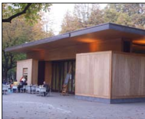
PAVILLON SCHÜTZENMATTE BASEL