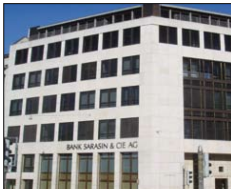
BANK SARASIN BASEL

Material: Diverse Materialien wie Polyurethan, Polystyrol, Steinwolle oder Schaumglas in diversen Stärken, Ausführungen wie Gefälledächer.