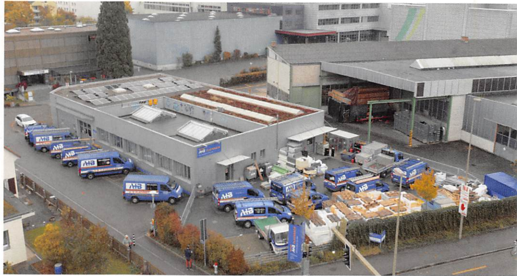
2018 wechselte die Firma den Standort von Basel nach Reinach.

Der vielsagende Titel verrät, dass wir es hier mit einem Unternehmen zu tun haben, das im Baugewerbe ganz oben tätig ist und diese überblickende Stellung auch behalten will. Dies tut die 1924 gegründete und seit 2005 als A+B Flachdach AG bekannte Firma mit Erfolg und Kontinuität. «Dicht durchdacht» heisst das im Originalton.